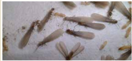
ヤマトシロアリ (羽アリ、働きアリ、兵隊アリ)