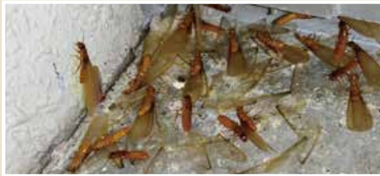
イエシロアリ (羽アリ)

日本で建造物に大きな被害を与えるのはイエシロアリとヤマトシロアリの2種類です。前者では6月～7月の夕方頃に、後者ではゴールデンウィーク前後の日中に羽蟻が群飛します。これらの羽蟻を見つけることで、シロアリ被害に気づくことがあります。